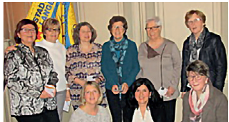
Die fleissigsten Helferinnen der Frauenriege wurden mit einem GfL Gutschein beschenkt.