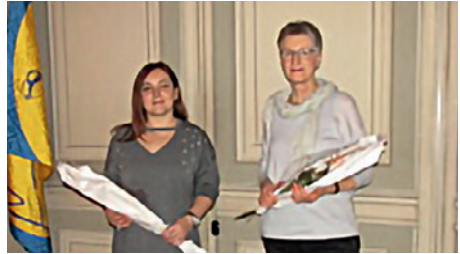
Die Anwesenden Neueintritte der Frauenriege wurden mit einer Rose willkommen geheissen.