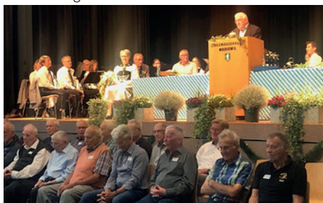
Ehrung der Jahrgänge 1943, 1933, 1938 u. älteren