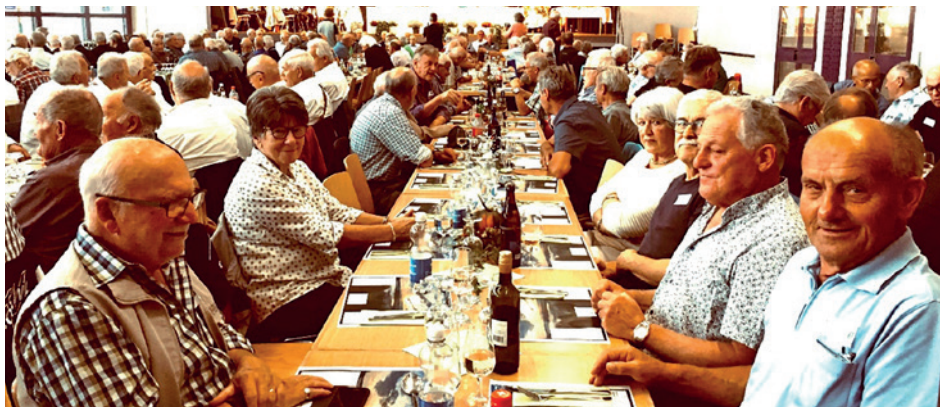
«Langenthaler Tisch»

Nach einem vorzüglichem Mittagessen, gemütlichem Beisammensein und Austauschen von «weisch no?», begaben sich die Turnveteraninnen und Turnveteranen, mit Vorfreude auf die nächste «Turnveteranen-Landsgemeinde», welche am Samstag, 26. Oktober 2024 in Langnau i.E. stattfinden wird, auf den Heimweg. Ein herz-